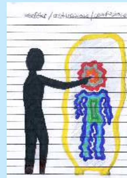
realtà / astrazione / confusione