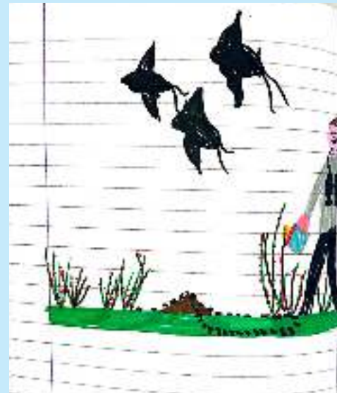
D.C. daje Roma daje