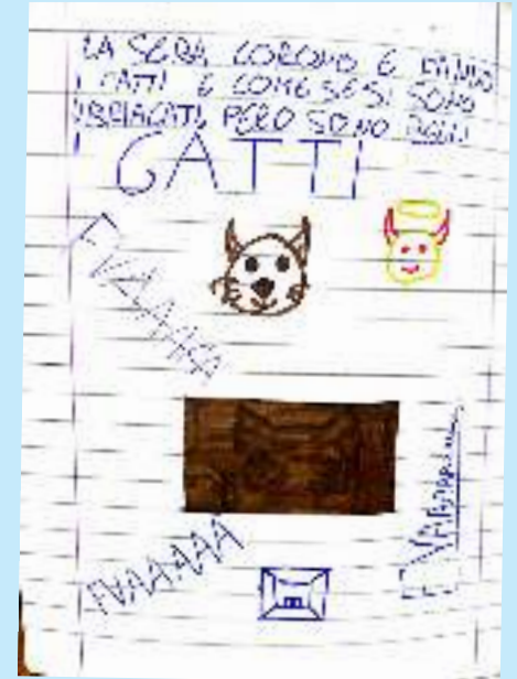
Evviva i gatti (pag.21) D.C. daje Roma daje