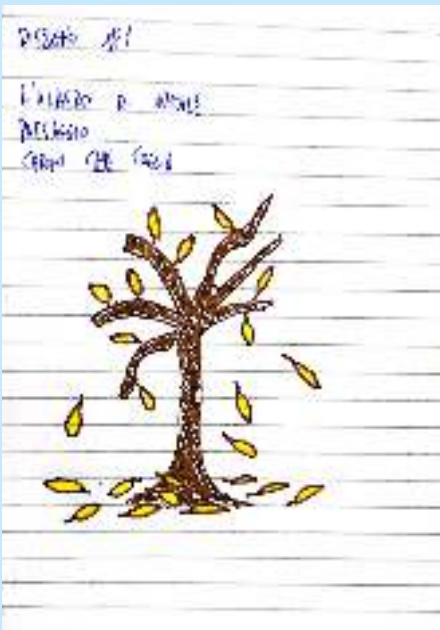
Disegno L'albero di Natale - Paesaggio Cadono le foglie