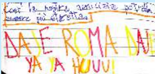
Così la nostra amicizia potrebbe essere più stretta. B.C.