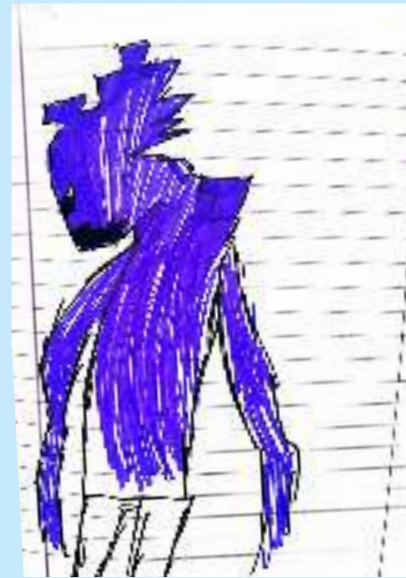
C.G. Dybala 21

CARA-MELLA- È-MORTA-DELLA -MANDA-RINO- BACI-NELLA