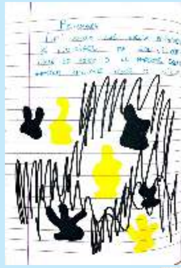
Primavera (pag. 20) S.G. gruppo giesuppine