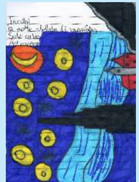
Incubi La notte stellata di van gogh Sole caldo. Astronave