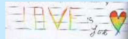
Love is Love A.C.