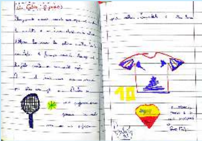
Un colpo sicuro (pag. 20) C.G. Dybala 21