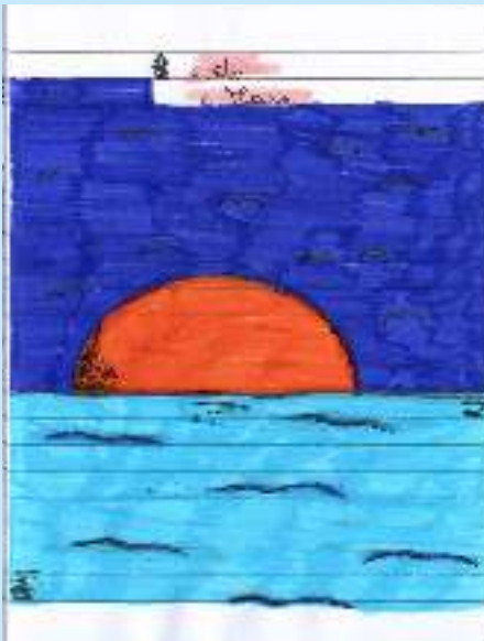
Cielo e Mare