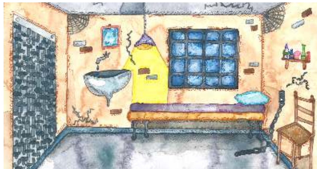
Illustrazioni di Matteo Corduas

Il Corno d'Africa, una regione situata nella parte est