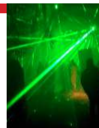
Torna a novembre 2023 l'Orto Botanico con luci e musica

26 GENNAIO. Nel Rione di Trastevere, una delle zone più caratteristiche di Roma, dove fra l'altro, c'è ancora la casa di Lucio Dalla, sulla quale recentemente è stata affissa una targa, va in scena un vero e proprio spettacolo di luci. un percorso di un chilometro e mezzo immerso in giochi di luci e musica. Una lunga passeggiata, all'interno dell'Orto Botanico, immersi fra piante, laghetti, salite, discese, e spazi particolari, resi unici da giochi di luce e atmosfere magiche. Un pomeriggio diverso dal solito, per far divertire i bimbi, ma anche i grandi! insomma un luogo per sentirsi bene, e farsi catturare dalla magia!