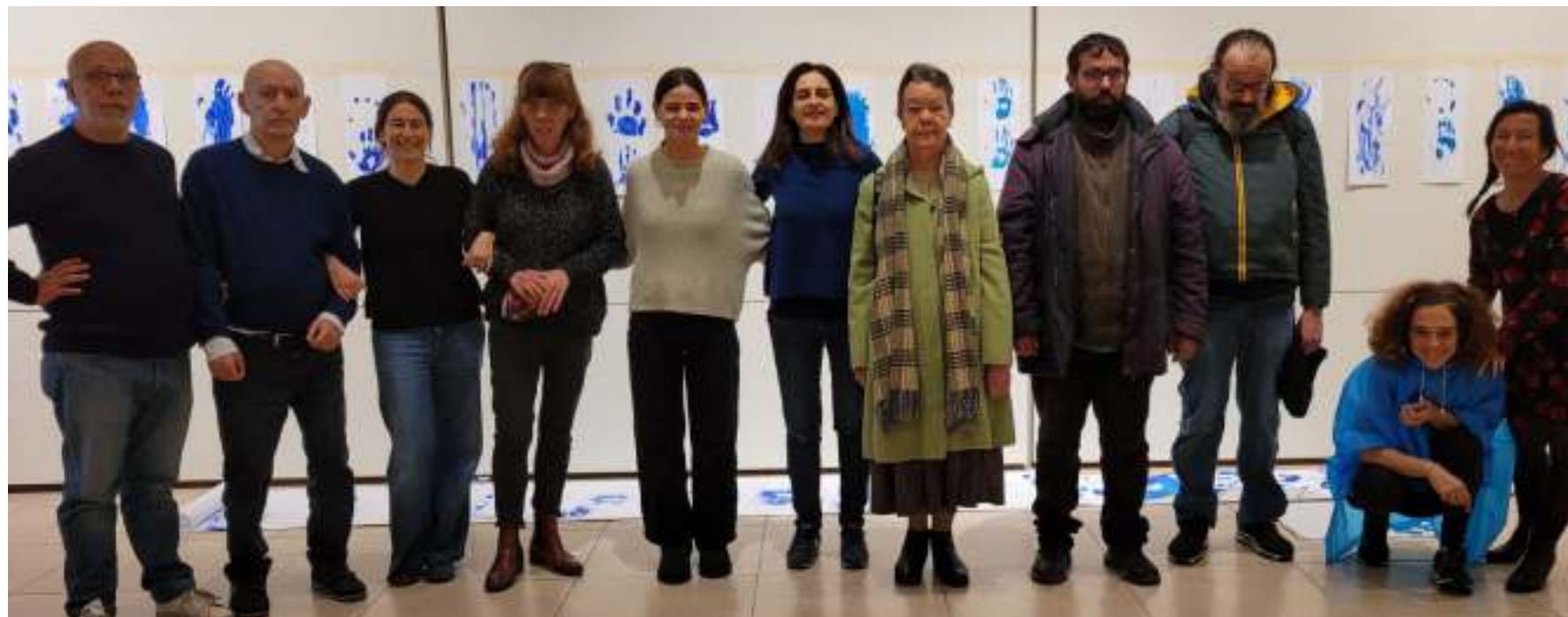
La foto grande è stata scattata al termine del Laboratorio Blu con tutti i partecipanti. In basso: alcuni momenti delle attività