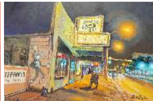
Quadri e sculture in mostra